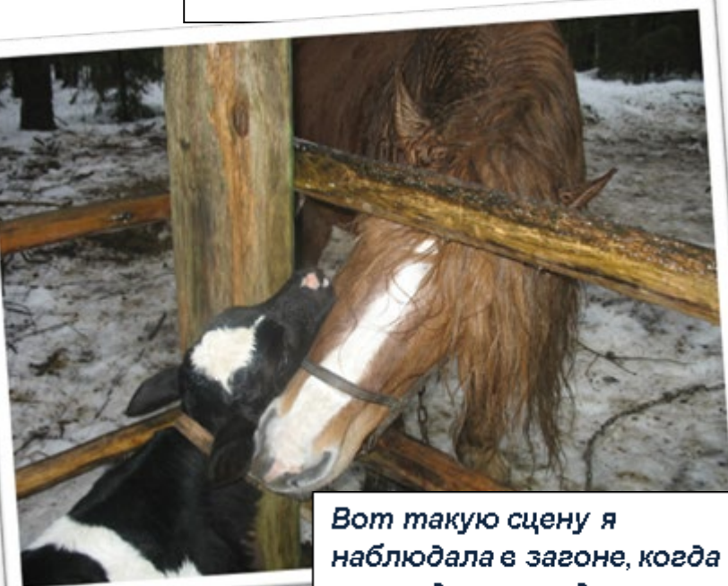
Вот такую сцену я наблюдала в загоне, когда мы отдыхали в деревне.