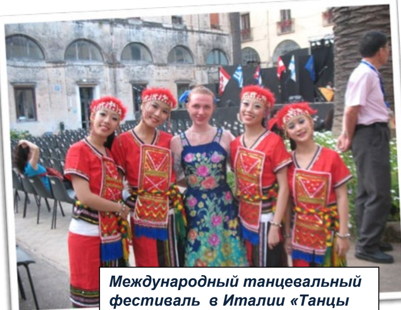
Международный танцевальный фестиваль в Италии «Танцы народов мира»